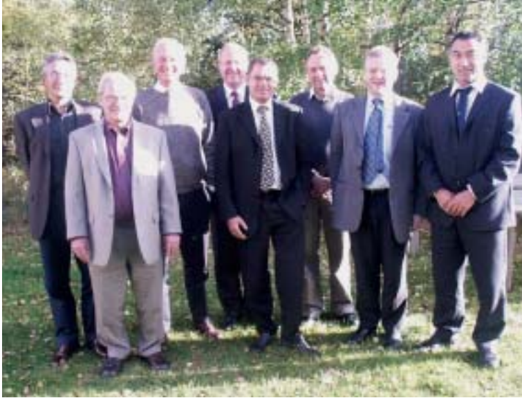
INUUSSUTISSARSIORNERMIK INERIARTORTITSINERMUT ATAATSIMUT ATAATSIMIITITALIAQ